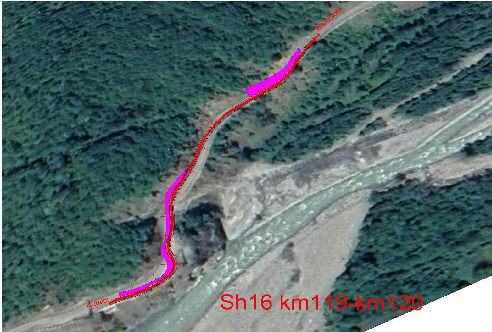
დანართი 1: პროექტის ადგილმდებარეობის რუკა ქუთაისი-ალპანა-მამისონის გზის (შ 16) მონაკვეთი კმ 119 – კმ 120 რეაბილიტაცია